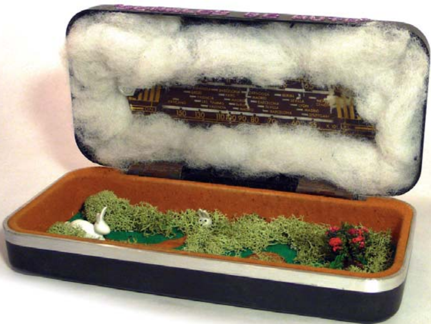
Señales de ruta