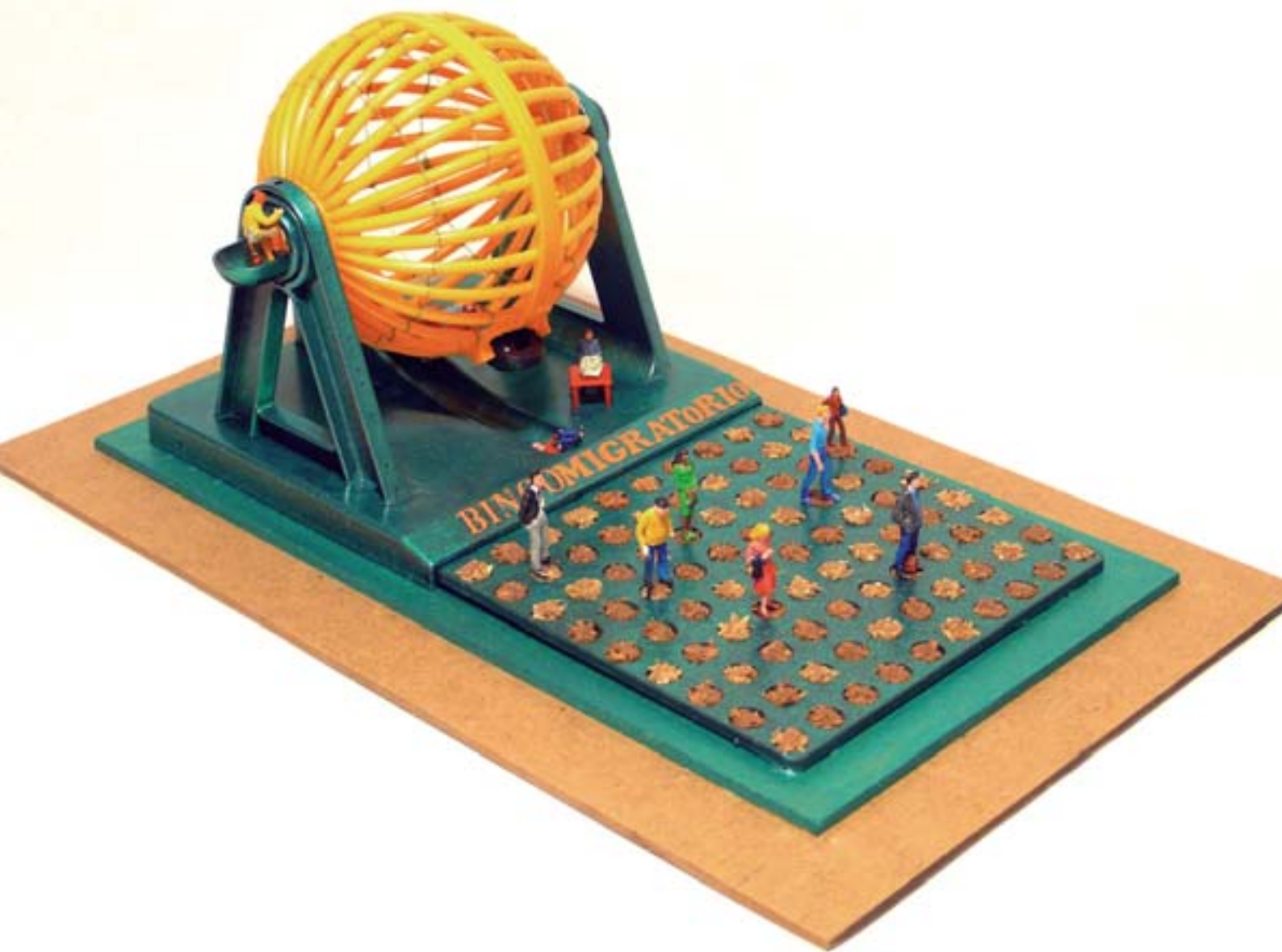
El bingo migratorio